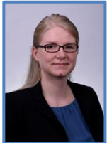
K. Albrecht AR-SK 125