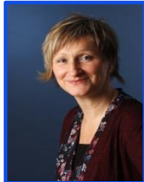
S. Sauerwald AR-SK 125