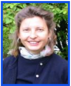
F. Schmiegelt H-C 9