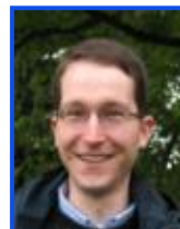
A. Wellbrock AR-D 6015