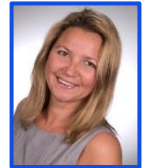
O. Kurz H-C 6316