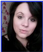
K. Gerkrath AR-SK 129