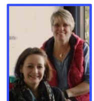
Sekretariat K. Jenke / M. Grams AR-C 3004