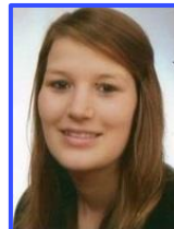
S. Hartmann AR-D 6015