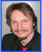
Ltg. Didaktik d. Biologie Dr. H. Kunz H-C 9