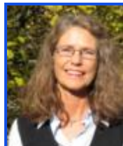
M. Armbrust AR-D 6015