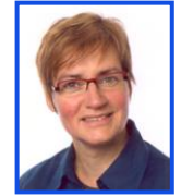
Ltg. Organismische Biologie Prof. Dr. K. Witte AR-C 3011